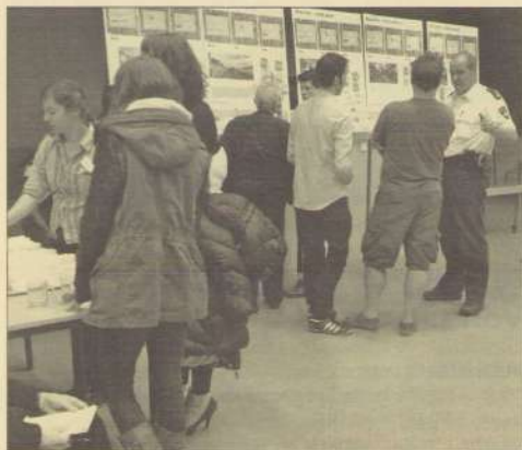
Er was volop belangstelling op de bijeenkomst van Servatius.

Woningstichting Servatius overweegt om in de toekomst van een aantal huizen aan de oostkant van de Tillystraat "klushuizen" te maken. Klushuizen zijn koopwoningen die door de eigenaar zelf worden opgeknapt. Dit werd duidelijk tijdens de presentatie in het Trefcentrum over de herinrichting van de Tillystraat en de Stadhoudersstraat. Over enkele jaren komt hier nieuwbouw en Servatius liet zien dat er verschillende ideeën leven over de nieuwbouw: allerlei verschillende woningtypes voor senioren, starters, huur- en koopwoningen. De geïnteresseerden en belanghebbenden konden hun vragen en commentaar rustig uitwisselen met de architecten, die vooral meningen vroegen over onder meer het stratenpatroon, pleintjes, spelen en parkeren. Alle opmerkingen werden op plakpapierjes bewaard. Volgende keer komen ze met hun voorstellen over de nieuwbouw.