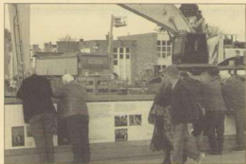
De ondertunningswerkzaamheden blijven bekijks trekken, op 24 mei is weer de openbare Dag van de Bouw ( www.a2maastricht.nl ).

Als je in de Bauduinstraat loopt is gaandeweg de bovenste uitgaande tunnelmond niet meer te vermijden: wat een bult komt daar te liggen! Gelukkig maar dat die mooi groen wordt aangekleed en dat er wegen zijn naar de overkant. Anders zouden de Schaeppmanflats wel erg geïsoleerd blijven: tussen paardentunnel en stoplichten-Terblijterweg. We zijn benieuwd hoe de uiteindelijke afwerking zal worden. Daarom maar weer eens naar het A2-voorlichtingsbureau op De Geusselt, waar we uitvoerig werden bijgepraat over de bouwwerkzaamheden: altijd weer indrukwekkend! De toren-kantoor-flat er bovenop wordt filmisch nog steeds vertoond, alsof de vastgoed-ontwikkeling geen deuk heeft opgelopen. En: moeten de nog bestaande flats aan de Rooseveltlaan nu nog wel echt weg, vroegen we ons af. We zijn benieuwd naar de plannen op en langs de groene Loper en de inspraakplannen daarover door de Gemeente.