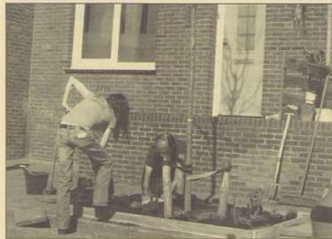
Een groep vrijwilligers helpt buurtbewoners om hun boomspiegel een opknabbeurtje te geven of een geveltuintje te beginnen.

Wittevrouwenveld bruist van de activiteiten deze fijne eerste lentedagen. Er wordt hard gewerkt om de wijk groener en mooier te maken. Wat te denken van het boomspiegelteam en de wild zaai plannen die opborrelden tijdens het laatste sociaal café.