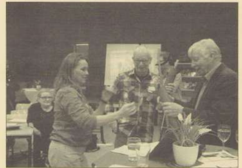
Tijdens het sociaal café van 28 maart arriveerden ook de aangekondigde prikkers voor het Volta-plein. Maar zijn ze eigenlijk nog wel nodig? Geruchten gaan dat de boel veel beter wordt schoongehouden.

Ideeën zijn welkom. Misschien kunnen we zo het KPN-terrein aan de overkant opvrolijken en de groenstrook Terblijterweg/Geusselt?