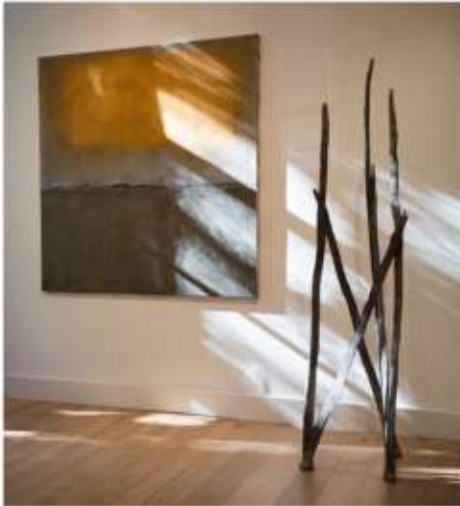
Dan Bar, Bronze: Six Pieces