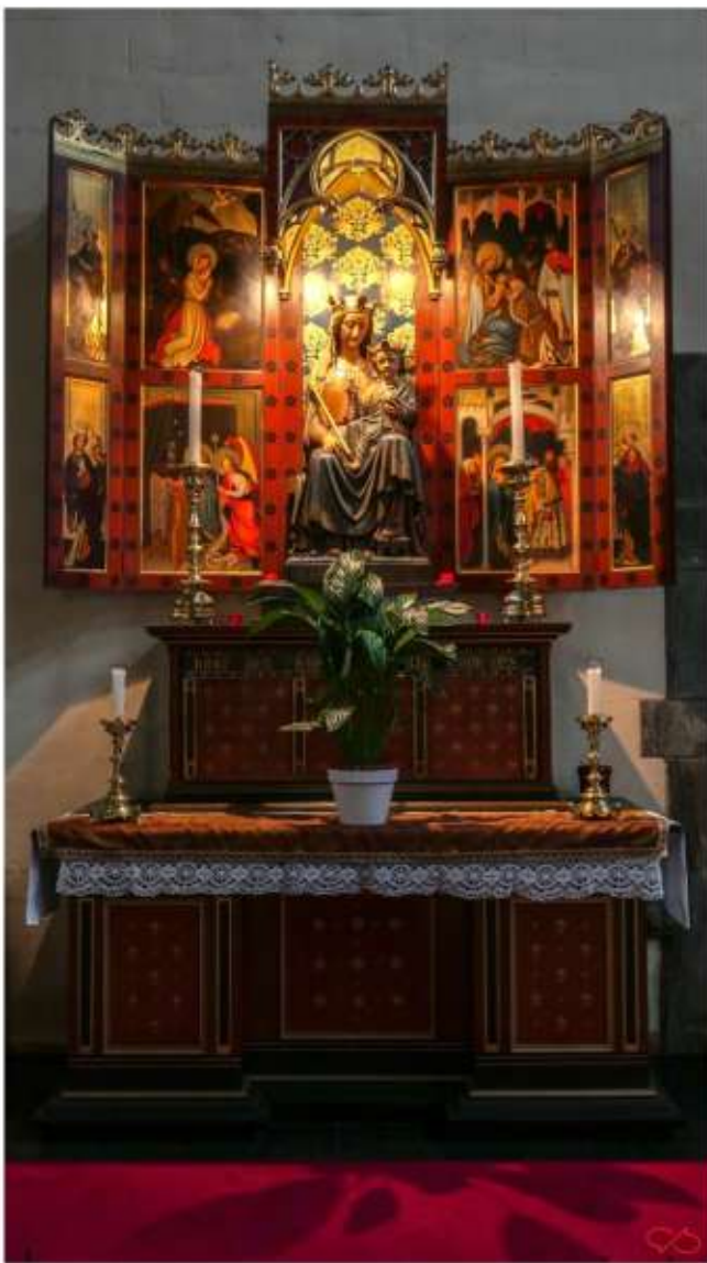
Een retabel met een beeld van Maria er voor. Het geheel doet met dat plantje bepaald huiselijk aan.