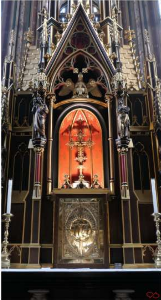
De absis en het altaar.

Vorige pagina : close up van een van de luchters. Ze zo fotograferen levert altijd bijzondere beelden op.