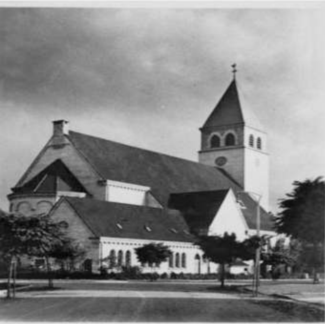
St. Antoniuskerk, Scharn - Maatsicht