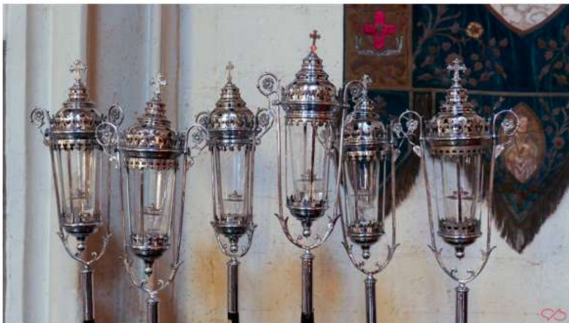
Kijk, zes flambouwen. Dit zijn olielampen aan een lange stok die megedragen worden met processies. Men droeg ze naast het processiekruis. Toeschouwers hoorden te knielen tot de flambouwen voorbij waren. 19e eeuws zilverwerk.