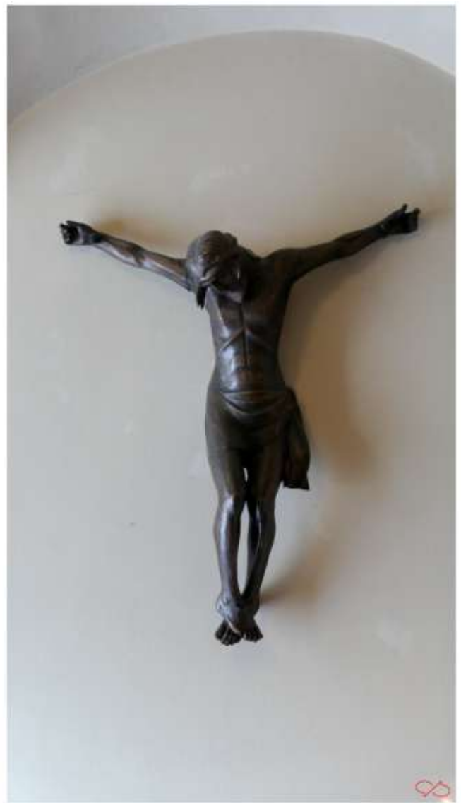
In de Banneuxkapel, links van de kerk, hangt deze prachtige corpus christi.