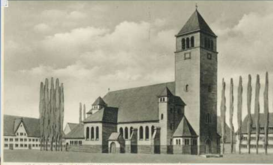
Sicht der Bruchter Kapel St. Antonius in Scharn (18)