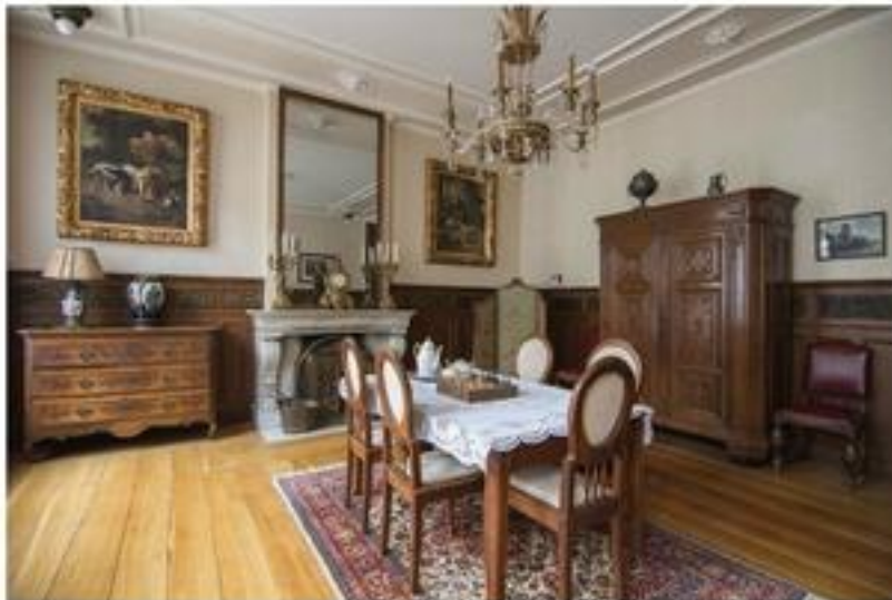
De Luikse kamer' in het woonhuis van de familie Bosch.

Geschiedenis op Facebook is niet het enige dat mij bezig houdt. In 2013 lanceerde ik met een stel vrienden het idee om een nieuwe bierbrouwerij in Maastricht te starten: het concept van 'De Maastrichter Bierbrouwerij' werd geboren en inmiddels zijn reeds twee biertjes door ons gelanceerd: Lansmenneke (blond) en Vääske (donker). Een derde bier (wit) is recentelijk gelanceerd: Pottemenneke, een eerbetoon aan alle arbeiders die gewerkt hebben in de aardewerkfabrieken in Maastricht. Uiteraard heeft dit idee ook met geschiedenis te maken: het brouwerijverleden van de stad laten herleven. De namen van onze bieren zijn ook gerelateerd aan de geschiedenis van de stad: het Lansmenneke werd vernoemd naar de Maastrichtse bierbrouwer Jan Lansmans die in 1638 naar aanleiding van het beruchte 'Verraad van Maastricht' werd onthoofd en een van de 'Vief Köp' werd. Het Vääske ontleent zijn naam aan Sint Servaas, de patroonheilige van Maastricht. En niet alleen stam ik af van meerdere Maastrichtse notarissen, ook het bloed van diverse bierbrouwers uit Maastricht en omgeving (waaronder Sint Pieter) vloeit rijkelijk door mijn bloed.