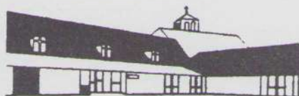
tot stand in het TREFCENTRUM

kerkfeesten bruiloften vergaderingen verenigingsactiviteiten bedrijfsfeesten